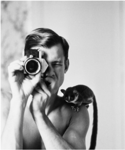
Peter Beard with Minor the bushbaby at Hog Ranch, 1968

Quelques temps plus tard, il va étudier les éléphants et les rhinocéros. L'une des choses les plus importantes de son travail est pour moi, The End of the Game , l'un de ses ouvrages qui révèle la disparition de plus de trente-cinq mille éléphants suite à la sécheresse, qu'il définit comme l'asphyxie des terres et celle de la diversité de la nature. Il disait que les éléphants étaient plus similaires à l'homme qu'aucun autre animal, que comme l'homme ils avaient mangé leur habitat, l'avaient piétiné et ils étaient morts sans que l'homme ne comprenne ce message.