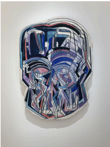
« Fractured Face for MEF »

Dans « Fractured Face for MEF » on retrouve les traits du cubisme développé en premier par Pablo Picasso et Georges Braque au début du XXe siècle. Ce que j'aime dans ce portrait, c'est le jeu des traits et des formes, la structure du visage mais aussi les couleurs.