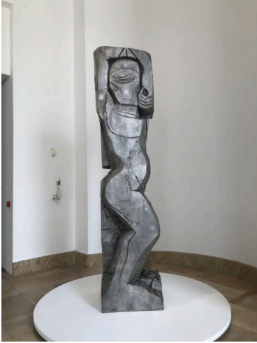
« Rattlesnake figure »