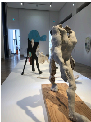
« Walking Man »

Dans les oeuvres de Thomas Houseago j'ai vu des inspirations, des ressemblances à certaines œuvres de Rodin, de Brancusi et même de Picasso. »L'homme qui marche » de Thomas Houseago, dans la deuxième salle de l'exposition, a des similarités avec « l'homme qui marche » d'Auguste Rodin, en faisant référence à l'homme musclé et à l'énergie.