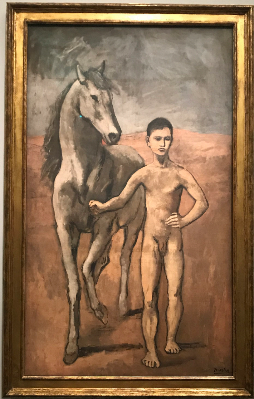
Mentor de Cheval 1905 Musée d'Art Moderne de la Ville de Paris