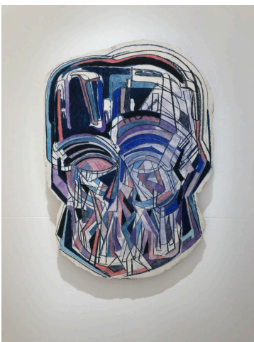
« Fractured Face for MEF »

Dans « Fractured Face for MEF » on retrouve les traits du cubisme développé en premier par Pablo Picasso et Georges Braque au début du XXe siècle. Ce que j'aime dans ce portrait, c'est le jeu des traits et des formes, la structure du visage mais aussi les couleurs.